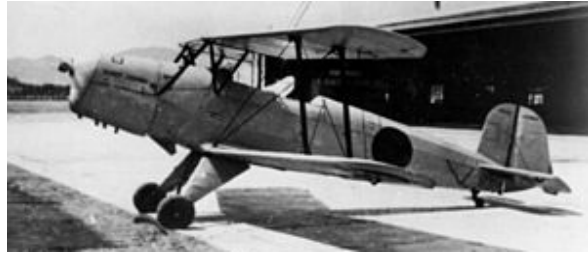
A&W 1:144シリーズ 最新作!!